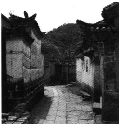
图1 大门对面的照壁

筑,但其庭院的规模并不大,这种墙壁一般处于建筑庭院内部,并且是单面的,起阻挡从内向外的视线的作用,故称为照壁。另外云南民居大门前的占地面积也比较有限,并不适宜设置独立式的照/影壁,即使要建独立的照/影壁,也只能紧贴着对面建筑的墙面来建,最终只好失去影壁一面、保存照壁一面,所以也称为照壁(见图1)。值得注意的是,由于没有了影壁,滇西北民居多利用入口的转折来阻挡外来视线。