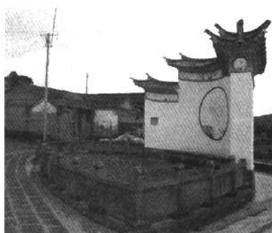
图3 和顺村外巷口照壁

美。中国传统住宅多成院落式,所有的门窗都开向内部天井,不想把家中的一切展露给外人,具有很明显的内向特征。滇西北民居的门总要通过入口空间的转折、屏门、影壁等形式来避免外面的人直接看到里面,让人从大门和影壁的装饰上猜测这家人的地位财富,呈现出一种“犹抱琵琶半遮面”的含蓄美。