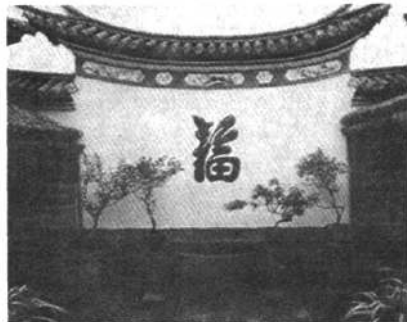
图7 和顺民居的照/影壁