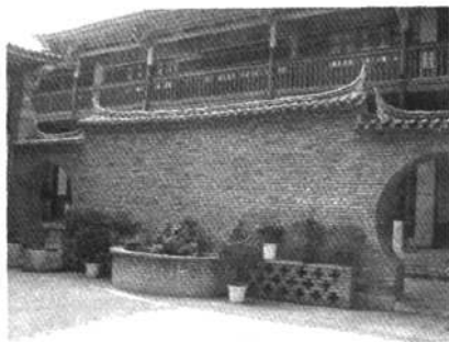
图6 石屏民居的照/影壁