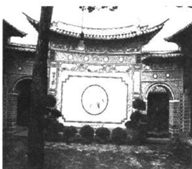
图2 巍山民居中的院心照/影壁