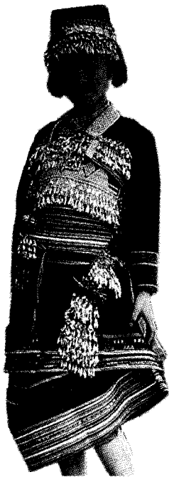
图1 花腰傣服饰整体效果图

花腰傣服饰的基调,从上到下大体由自织的黑色土布组成,从质地和颜色上看去,显得极淳厚朴素、柔和内敛,给人亲切之感。这种形式、质地和颜色的服饰,给人一种深沉凝重、含蓄蕴藉之美,使人领略到东方式的静穆崇高、神秘朦胧之美。这种黑色更有一种空间感和深度感,让人产生一种能吸收和包容一切的感觉。