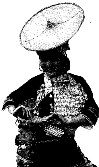
图2 花腰傣的斗笠及秧罗效果图

傣雅斗笠(见图2)在其服饰中占有重要地位。据傣雅传说 [4] ,傣雅斗笠象征圆满幸福的爱情,因此花腰傣妇女都有戴鸡棕斗笠的习惯。斗笠最初也以避雨、遮阳或遮面之实用功能为主,