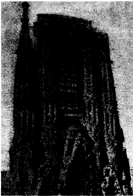
图1 《艺术界》1926年第8期介绍的安东尼·高迪的建筑

灵风就受到比亚兹莱的影响,制作出了大量的比亚兹莱风格的插画,获得了“东方比亚兹莱”的称号,由此可见中国近代美术期刊对西方现代主义设计传播的广泛性和对中国设计深刻的影响力。