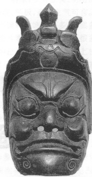
图1 黔北仡佬族傩面具中的“土地” 图2 黔南汉族傩面具中的“土地” 图3 黔北傩戏中的“开山”