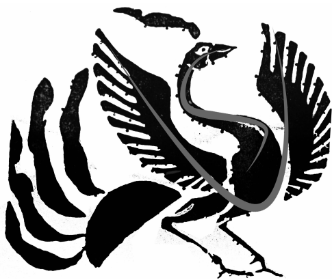
图3 汉代画像砖朱雀纹

秦汉时期朱雀形象的一个重要特征就是身躯曲线化和概括化,其身躯造型是整体动态造型得到展现的载体。其体态多为勃发向上的“U”形轮廓,由颈至身又呈现出“S”形的曲线特征(见图3),再加上时而收拢向上、时而飞翔展开的翅膀,展示出一种矫健豪放、体态轻盈之风。秦汉朱雀纹样的腿部造型也极具特色,它截取鹤足的纤细骨感特征,以前腿向上迈进、后退脚掌地的蹬腿奔跑姿势,或以双足前脚掌着力的停歇动态传递出一种强烈的力量感。