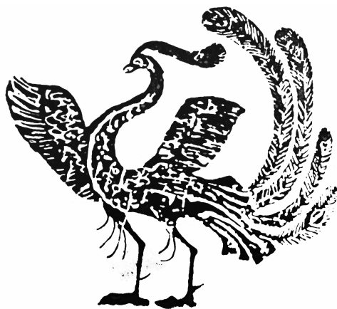
图5 河南南阳汉代铺首朱雀纹