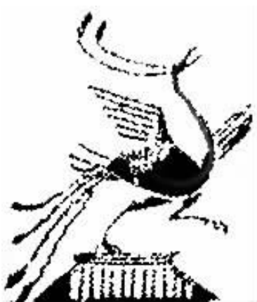
图4 四川汉代朱雀纹

秦汉的朱雀造型,特征之一是向心性线性造型,其整体造型向一个看不见的中心点聚拢,以形成一种拉伸的张力感,渲染动态之美。这种线性造型处理传递出浓烈的骨感特征,如头部、颈部,尤其是腿部造型纤细却有力,这种有力的骨感体现出一种矫健有力的蓬勃生机。秦汉时期的朱雀造型在设计构图中增加了理想化的元素,如伸展到极限的身体弧线等,以这种生动的弧线来塑造形象、表情达意。朱雀的造型形象矫健有力、动感多变,形式的动感方向呈曲线流动,体现出轻快、活泼的视觉审美特征。流动的线能造就不同的视觉效果,线