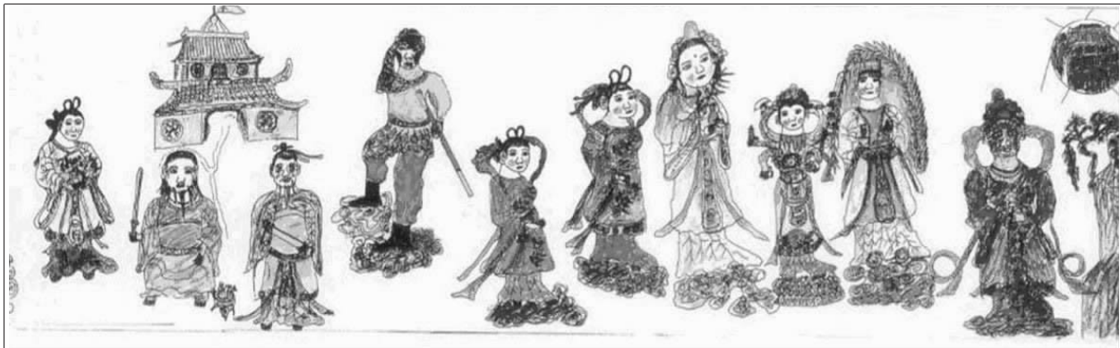
图1 《西游记》人物图帐

《白蛇传》故事图帐(见图2)主要选取重点故事情节——水漫金山寺的故事而作:一边是寺庙楼阁,在楼阁之上团云的上边,法海大师盘腿坐于莲花形佛座上,身披袈裟,手拨念珠,身边一小和尚肩背禅杖,伺候于旁;一边是白蛇姑娘和青蛇姑娘,其中白蛇姑娘在上,头挽高髻,一身白衣,双手持剑,正在施法,其下是青蛇姑娘,头挽高髻,一身青衣,双手持令旗,似在协