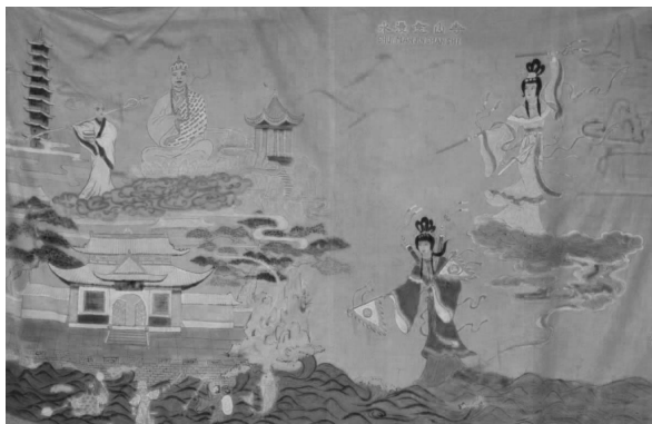
图2 “水漫金山寺”帐(布质)

神话动物是人们根据现实世界中的动物原型创造出来、集多种动物形象于一体的幻想物种,这类动物,被中华民族的先民们赋予了重要的神话功能。神话动物类题材在帐盘中表现较多的主要有龙纹和凤鸟纹两类,它是一种民间图腾信仰的孑遗。