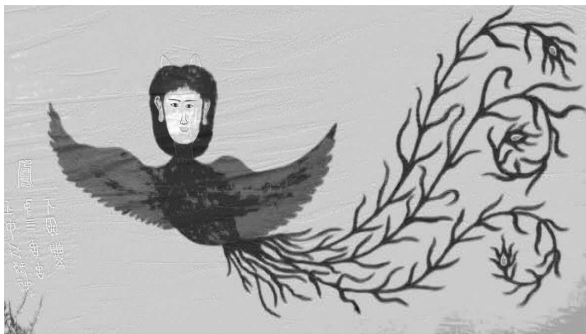
图3 人面鸟身人物帐

九莲山帐盘中龙的造型主要采用了历史上比较成熟的龙的图案——仅在色彩上有差异,有用墨线勾勒的,有用红色、蓝色等色彩平涂的;在画面构成上,一般采用双龙组成一个单元,或者与其他神话动物(如凤)共同组成一个画面(见图4)。龙、凤共同组成构图内容出现在同一画面中有着重要的寓意。乔台山先生指出:“龙代表阳,凤代表阴,龙凤同时出现于同一幅帐中代表阴阳结合、阴阳平衡。” [1]