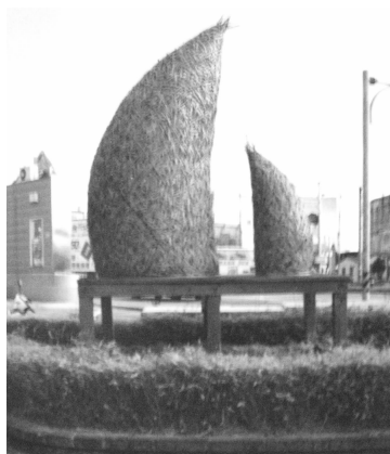
图4 南投县竹山镇《竹笋》

台湾民众历来崇尚自然生态,其乡镇地标公共艺术作品必然展现这种特定的庶民美学风貌。台湾地标公共艺术不仅追求美的艺术形式和视觉效果,还在乎场的意识、对公众理解的发掘,以及公众的参与和文化的选择等,而这一切都是庶民美学的