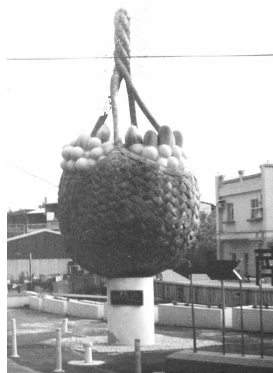
图2 台南南化北寮镇 《水果之乡》