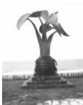
图3 新北市北海岸 《芋头之乡》