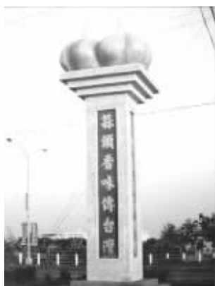
图1 嘉义县大林镇 《蒜头》

地标公共艺术是多介质的艺术景观,在材料方面有很大的选择空间。台湾地区的乡镇地标公共艺术作品的制作多遵循经济、实惠的原则,尽可能使用具有地方特色