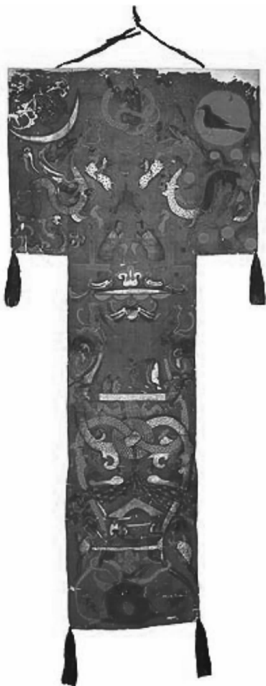
图1 马王堆汉墓T形帛画

的铭旌,但又比普通铭旌制作得精细华美,该帛画所绘的是灵魂升仙的象征场面,没有文字与魔语,而当时在铭旌和一系列魔镇器物上画符、写祝语和咒语已经很普遍。 [1]