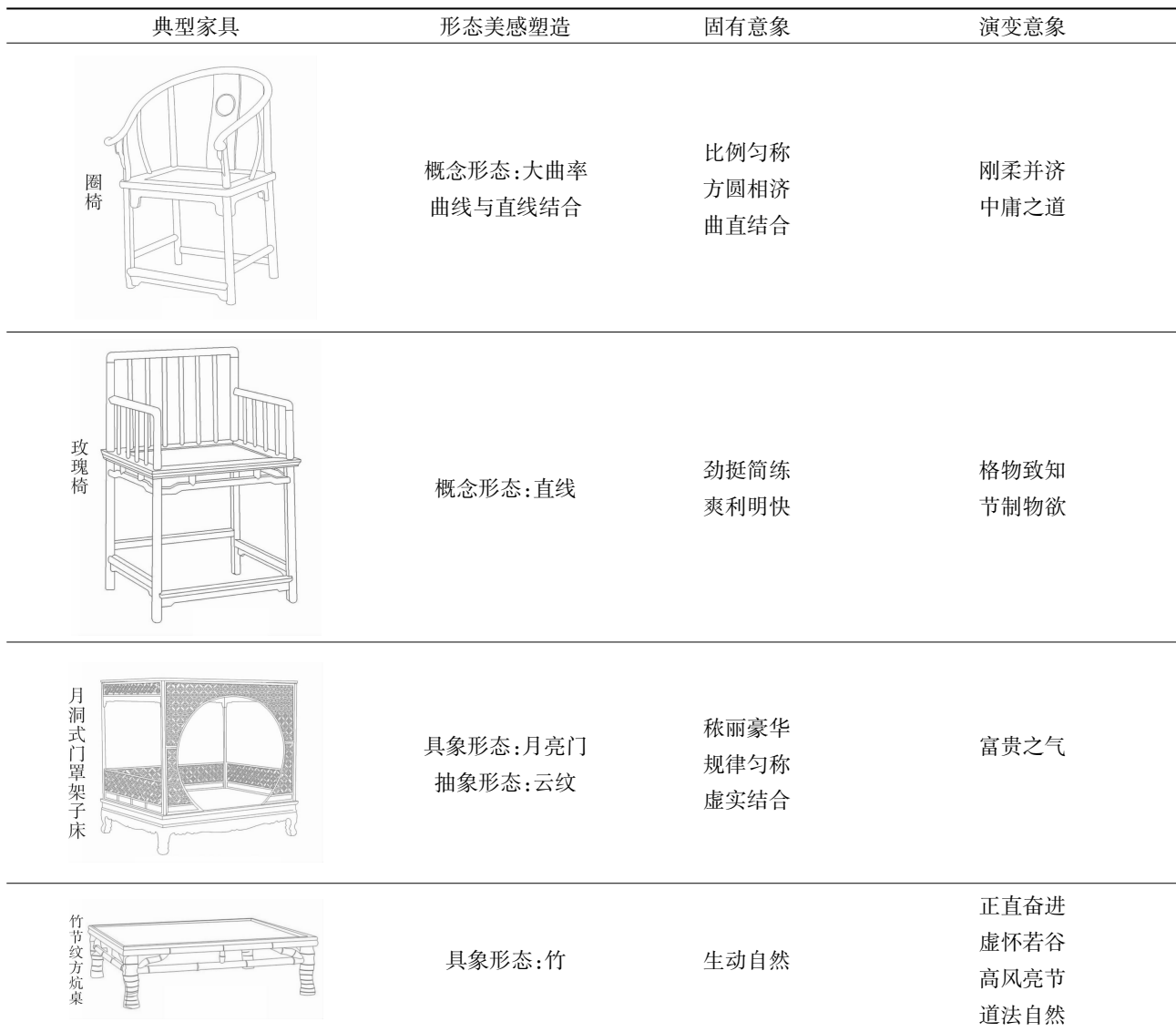
表3 设计思想、设计方法与形态意象的对应简表