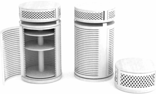
图3 鞋柜、穿鞋凳设计

态方面,图2通过线条、结构的简化,在保留明式家具基本风貌的前提下,按照现代人的审美观念,对其造型进行简化、变异和重组。这样的造型,既有当代设计的简洁,又有传统的神韵,可满足消费者对新中式家具的情感体验。图3则针对现代家居空间的功能性转变,选取不同于传统中式家具的类型,基于传统美学进行形态创新设计,通过形态传达生活个性和价值观念。两款设计在美感意象形态方面也各有特点,图2对圈椅造型进行符号化运用,即大弧度的椅圈曲线配合S型的靠背曲线,其意象特征侧重于神似,同时搭配布艺坐垫,凸显“现代”之意象。框架与圆形坐垫虚实结合,比例匀称,契合传统中式家具的中庸之道。图3厚实的圆柱体作线条分割,体态稳重而不失轻盈;俯视之曲线与正视、侧视之直线,虚实结合、方圆相济;抽象的菱形纹饰简洁整齐而又富有古韵的形式美感。