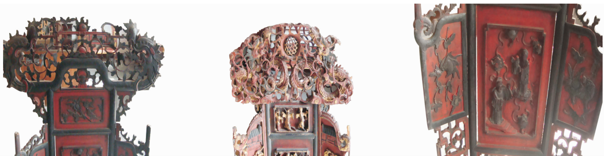
图2 湘西民间脸盆架雕刻技法示例