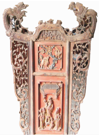
图3 脸盆架雕刻中“龙”图案的应用

“大闹天宫”等历史戏曲和神话故事,也都常常是脸盆架家具雕刻中所采用的民俗文化题材。采用含蓄和隐喻的设计方法也是传统脸盆架家具雕刻的创作手段,如“凤穿牡丹”,把牡丹和凤凰作为家具雕刻形象,有“富贵吉祥”的民俗内涵;“麒麟送子”的民俗解读就是祥瑞降临、圣贤诞生;“喜鹊登梅”则体现了人们期盼国泰民安的朴实心愿。功能与审美的和谐统一是我国民俗艺术文化造型的重要理念。这一重要理念在脸盆架家具的雕刻艺术中得到了充分的诠释和表达。 [6]