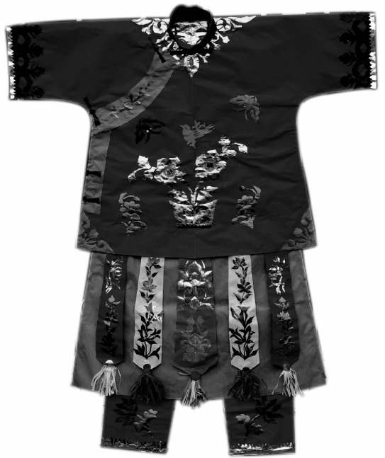
图1 濮阳县郎中乡王海村的神衣剪纸

豫北剪纸与豫西剪纸等相比,富有鲜明的地域风格,其艺术特色主要表现在品种与样式、题材、艺术风格与功能作用等方面。