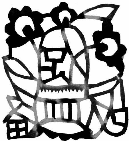
图3 豫北点彩窗花剪纸

从剪纸技法上,也有一些独特的剪纸工艺,如套色拼贴剪纸工艺,在豫北非常流行。这种工艺一般