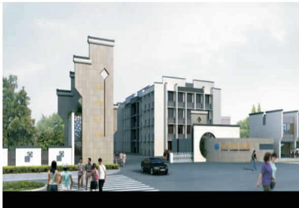
图5 安徽建筑大学北区大门设计