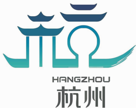
图2 “2016 杭州 G20 峰会”标识