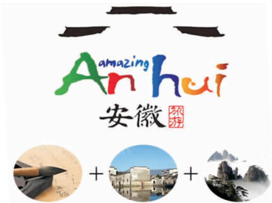
图3 安徽省旅游形象标识

文化是民族的血脉和灵魂,是国家发展、民族振兴的精神支撑。近年来,文化大繁荣大发展已被提升到国家发展战略的新高度,如今,越来越多的人成为文化发展中的弄潮儿。在国家文化大繁荣大发展的进程中,不同地区呈现出不同的速度与特征。而在异域文化和当代多元文化的多重影响之下,一方面,某些地区特别是三线以下城市的地域文化逐渐表现出式微的趋势;另一方面,部分地区尤其发达地区的地域文化快速崛起,拥有广大的追随群体,甚至享誉海内外。多年来,安徽省各级政府和社会各界都对实现安徽文化的大繁荣大发展做出了持续的努力,从省会城市合肥的发展战略口号“大湖名城,创新高地”与各级城市大刀阔斧的改革创新举措就可见一斑。以数字图形的形式,汇集安徽省各主要地域特色文化的视觉符号数据,构建安徽地域特色文化符号系统,发掘其潜