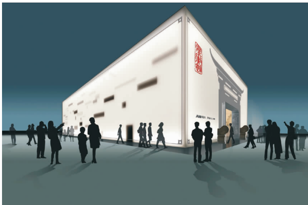
图4 2010年上海世博会安徽馆建筑外观