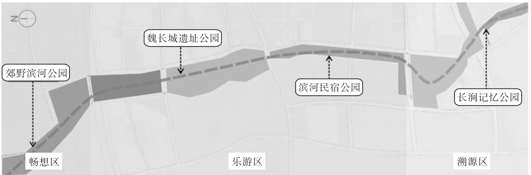
图2 华阴长涧河景观设计功能分区图

地较少。根据这种地域特征,规划者将老河堤保留并加以提升,设置新的坝体,拓宽河道水域面积,重点突出华阴城市历史,场地内设墙式文脉景观小品,体现和展示华阴文化,游人在溯源区可以找到长涧河传承的乡愁。乐游区域将重点打造华阴民俗主题公园,并与魏长城遗址相结合,使古老的民俗与实际存在的遗址相互呼应;该区域内设置华阴老腔、华阴皮影的展示橱窗与表演舞台,并以戏台商业街的形式存在。畅想区域以生态亲水为主,以低影响度开发为主要策略,建设郊野生态滨河公园;由于该区域毗邻华阴水厂,所以在该区域规划并设计了自然净水展示区,可用于普及污水处理知识,弘扬节水爱水文化,丰富场地功能。