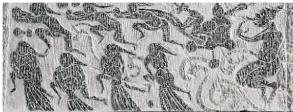
图1 风雨图(南阳汉画馆藏)

求物象之神似、融情于画、重视精神超于物象的创作宗旨,通过主观感知意象进行情感的真实传递。在“意”与“象”的关系上,始终坚持“象”为“意”服务的态度,没有“意”“象”处理孰主孰次之烦恼,“象”的选择与展现以“意”的传递和表达为根本,“意”与“象”始终保持高度一致。南阳汉画像石通过创作富有情趣自然轻松活泼的“象”,以唤起观者情感的触动与共鸣,最大程度地展现作品的吸引力和感染力。南阳汉画像石中所有的人物、动物、神仙的形象选择与展现,无论是细腰高髻的侍女,还是面目狰狞的力士和人首蛇身的仙人嫦娥、西王母,抑或是欢快的鱼儿、威猛的老虎,其形体美在画面中都得到了极致的发挥。在南阳汉画像石中,“象”的具体形式是围绕着意—情感这一主题来取材、夸张、糅合、展开的,完全超越了现实意义中物象的表达。在立意与表达的关系中,南阳汉画像石始终将立意与情感的传递置于首位。