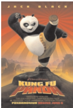
图5 《蜘蛛侠》海报 图6 《功夫熊猫1》海报

和民族性格的集中表现。文化是动画电影的灵魂,是动画电影创作的天然沃土。在全球化、信息化的今天,动画电影海报因其独特的艺术表现形式和文化内涵,成为各国宣传本国电影文化的一种重要手段。