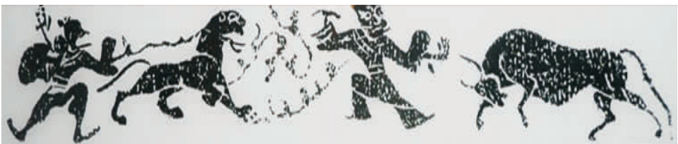
图9 “斗牛牵虎”汉画像石(拍摄于南阳汉画馆)