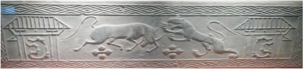
图7 “牛虎斗”汉画像砖(拍摄于新野县汉画像砖博物馆)

期,河南地区角抵戏十分兴盛,主要有象人斗牛、象人斗虎等 [5] 。这种斗虎娱乐的形式是当时百姓喜爱的节目之一。