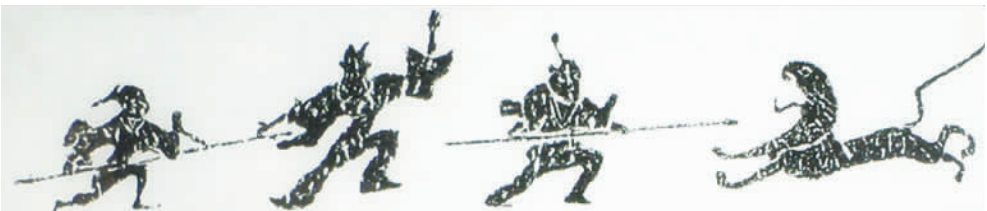
图10 “格斗·刺虎·驯虎”汉画像石(拍摄于南阳汉画馆)