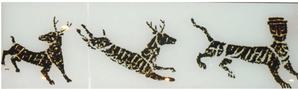
图6 “双鹿·人面虎”汉画像石(拍摄于南阳汉画馆)