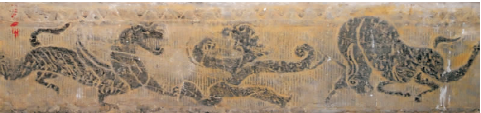
图8 “象人斗虎·牛”汉画像石(拍摄于南阳汉画馆)