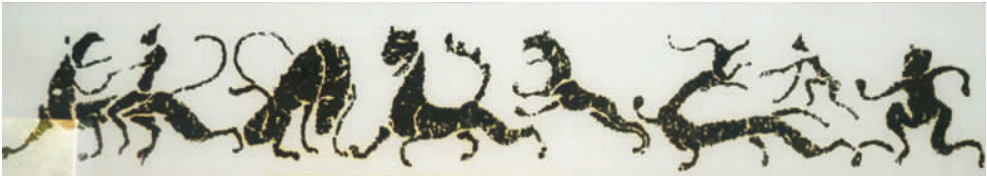
图2 “逐疫升仙”汉画像石二(拍摄于南阳汉画馆)