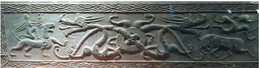
图4 “羽人·二龙穿壁·牛虎”空心汉画像砖(拍摄于新野县汉画像砖博物馆)