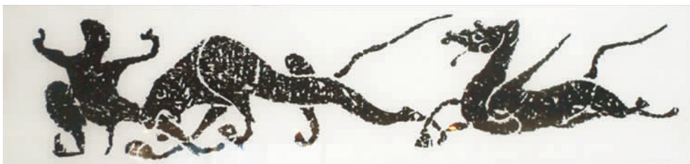
图5 “虎食鬼魅·天马”汉画像石(拍摄于南阳汉画馆)

在南阳市新野县出土的“牛虎斗”汉画像砖(见图7)中,右侧刻有一虎,前肢伸起、张口翘尾,向左边一牛扑去,牛则引颈挺角击打来敌,呈现出牛虎相斗而舞的场景。在南阳佟庄出土的东汉时期“象人斗虎·牛”汉画像石(见图8)中,一人戴面具,兼与两侧之牛、虎相搏,其左手紧抓牛的一只角,把牛的头摞在地上,同时用右手抵御从另一侧扑来的猛虎 [4] 。在南阳出土的“斗牛牵虎”画像石(见图9)中,右边刻有一人与牛相斗;左边刻有一人右手拿一钺扛在肩上,左手牵一用绳子绑着的虎。画面云气缭绕,反映了当时人们利用虎牛斗兽娱乐的社会风气。在南阳出土的东汉时期的“格斗·刺虎·驯虎”汉画像石(见图10)中,左边刻有两人各手拿兵器,持长矛和盾相斗,右边刻有一人头戴高帽、身穿盔甲、手拿长矛刺向对面飞奔而来的猛虎,呈现出的虎舞画面激烈而精彩。在