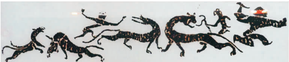
图3 东汉军帐营汉墓“方士升仙”画像石(拍摄于南阳汉画馆)