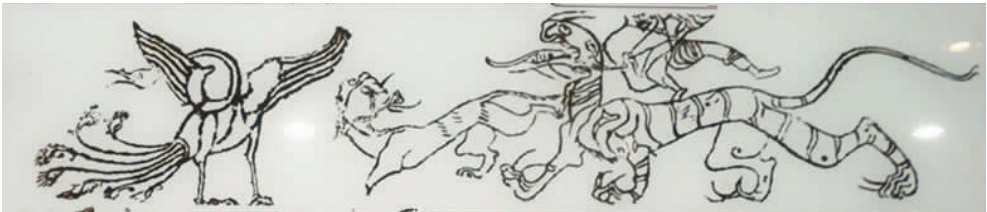
图1 “逐疫升仙”汉画像石一(拍摄于南阳汉画馆)

在南阳出土的东汉时期“虎食鬼魅·天马”画像石(见图5)中,右侧刻有一飞奔带翅膀的天马;左侧刻有一只猛虎张口咬住一鬼魅的左腿,鬼魅举手张臂,右腿蹬地用力欲拽出被猛虎咬住的左腿,鬼魅似人状,尾巴着地,面部惊恐。在南阳市唐河县电厂出土的西汉时期“双鹿·人面虎”汉画像石(见图6)中,左侧刻有二