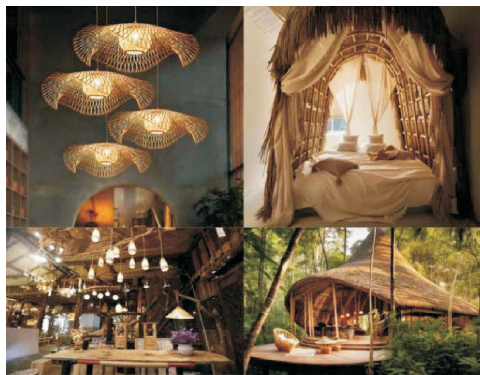
图3 传统手工艺与沉浸式空间贴合

在体验经济与参与式文化交织的语境下,传统手工艺正通过“创作民主化”机制重构乡村旅游的价值生产范式,将游客的瞬时消费行为转化为持续性文化资本积累。约瑟夫·博伊斯的社会雕塑理论在此得到新诠释——当游客在潮汕油纸灯笼制作中编织竹箴时,实则是通过具身实践参与着“乡村社会美学”的塑造。传统手工艺类别中有很多可供游客参与交互体验的项目,尤其是那些制作流程相对简便、简单易学、制作时间较短的项目,如广东潮汕的非遗油纸灯笼制作、四川的川剧脸谱绘画、山东潍坊杨家埠的木版年画拓印、山东郯城县红花镇的